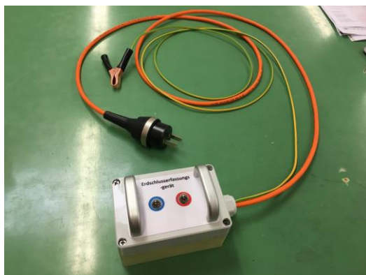
Dispositivo di messa a terra