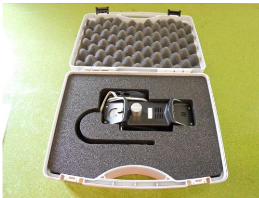
Microtel con lettore MP3